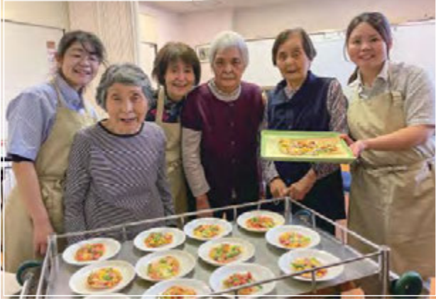
ひので理想郷の園

サンライズ鉄心坊では、今年も野球観戦に行ってきました。天候にも恵まれ、絶好の野球観戦日和となりました。応援団の太鼓やラッパの音に合わせて大声援が聞こえてきて、最高の球場の雰囲気観戦を楽しむことができました。ヒットを打ったり得点が入ったりすると「やった〜」「よく打った〜」と声援が飛び交っていて、皆さん興奮した様子で観戦を楽しんでいました。「テレビで見るよりやっぱり生はいいいね！」と皆さん大満足！帰りのバスの中でもずっと盛り上がっていました。ご利用者だけでなく、職員にとっても良い気分転換になりました。