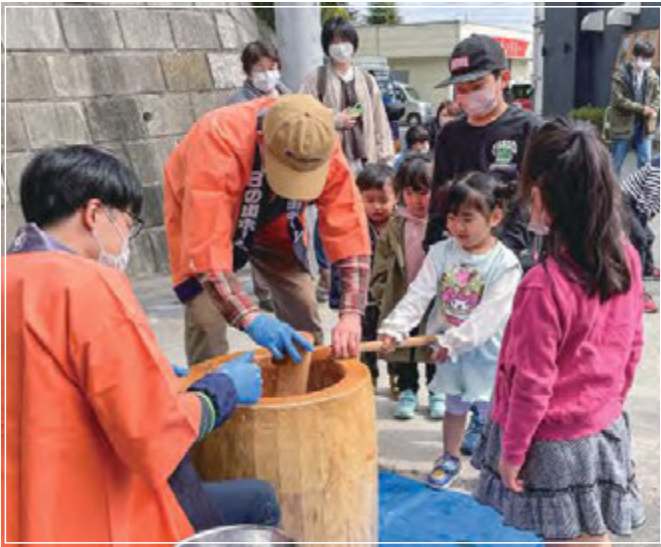
■サンライズむつみ橋で餅つき大会

4月、サンライズ小川の近隣にある八雲神社春の祭礼では、街をねり歩くお囃子がとてにぎやかです。サンライズ小川も休憩スポット