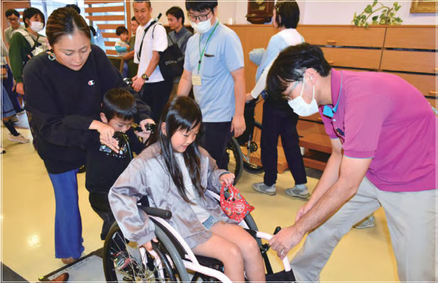
■「サンライズこどもフェスタ」で楽しみながら車いす体験 (P6に関連記事)

発行元 ■ Peaceful Partners Community (サンライズ後援会) 住所 ■ 東京都西多摩郡日の出町平井3076 PPC事務局 (ひのでホーム内) 電話 ■ 042-597-2021 FAX ■ 042-597-1973 e-mail ■ info@h-sunrise.com