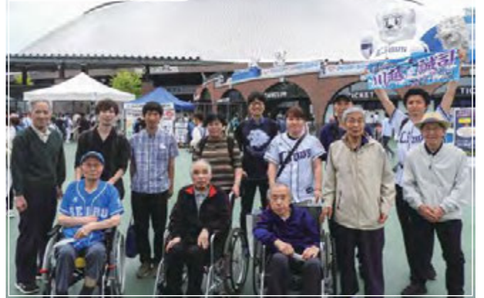
サンライズ鉄心坊

サンライズ小川では、「究極の蟹祭り」と題し海鮮食堂をオープン！ズワイ蟹、タラバ蟹のしゃぶしゃぶに新鮮なお刺身の盛り合わせ、さらに前日釣ってきたワカサギの天ぷら等々：贅沢な豪華海鮮ランチとなりました。目の前で魚をさばくところを見ていた方に話を聞くと「どうやって皮をはぐのかな、って思ってたね」と食べる前から楽しんでいる様子でした。できあがった豪華海鮮ランチを召し上がったご入居者の皆さんからは「最高の贅沢ね」「毎年楽しみよ。職員さんは準備大変だけど来年も期待しているわ！」と、皆さん大満足の様子でした。