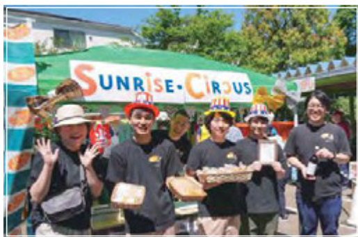
■ スプリングフェスタでPR

また、3年目となるサンライズ・サーカスですが、おかげさまで地域の皆さまに様々な形でご利用いただいております。地域の方向けにイベントを行う際にもご支援をいただくことで、より華やかにになると同時に、PPCの活動をPRする機会にもなっております。