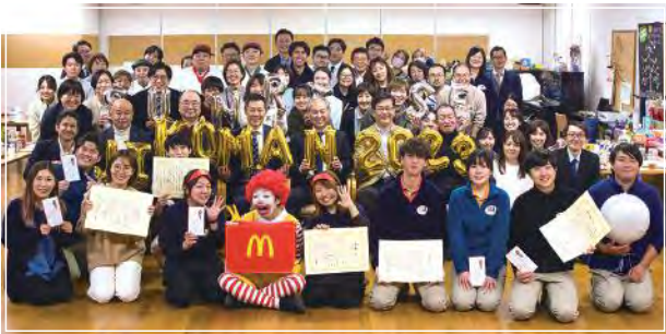
■ 自己満足コンテスト 2023