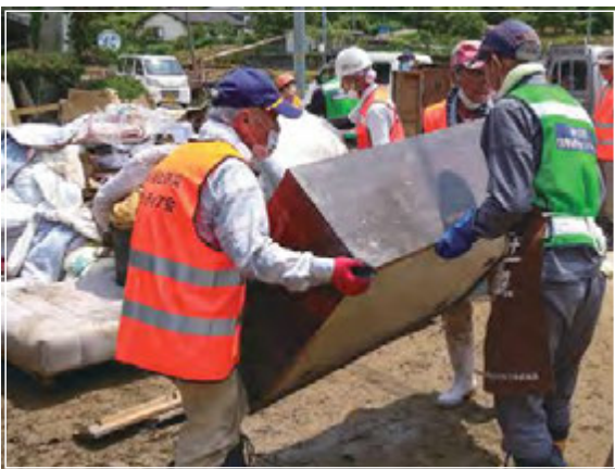
■令和5年6月台風2号による被害 | 和歌山県

PPCでは会長や理事の皆さまと連携し、社会福祉法人サンライズが以前より交流のある、社会福祉法人佛子園（石川県白山市）と、社会福祉法人牧羊福祉会（六水町）へ、物資と義援金の支援を行いました。令和5年度は、そのほかにも豪雨や台風で被災した9つの県へ支援を