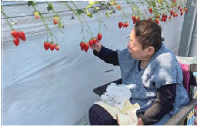
サンライズひのでだんち

年齢を重ねると一人では出かけることが難しくなります。それでも「行きたい！やってみたい」をあきらめずに実現することができると、そんなサポートをこれからも続けて行きたいと思えます。